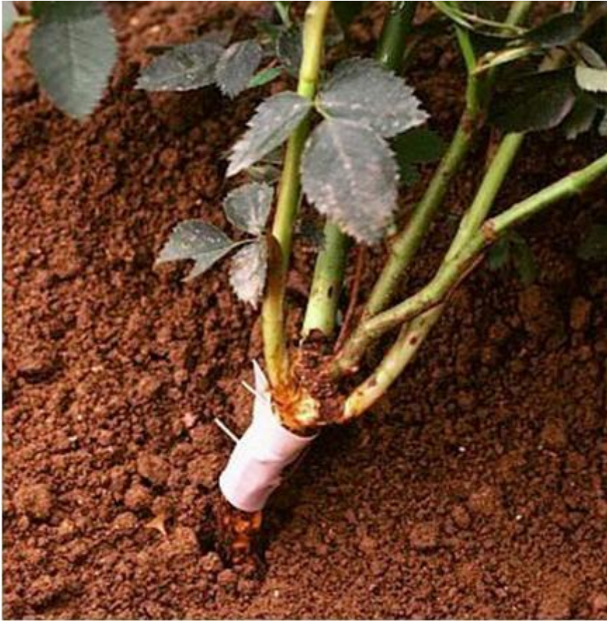
Una nueva naturaleza